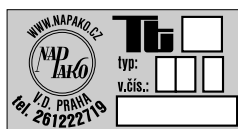
typový štítek dveří